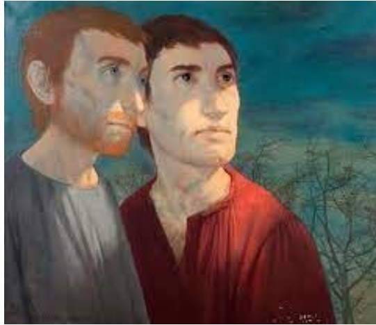
Emmaüs – Michel Ciry